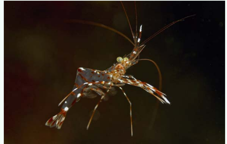
Freischwebende Garnele von Olivier Notz.

knapp hinter einem Medaillenplatz liegenden anderen Teilnehmer ermuntern wir, ihr Glück mit der Teilnahme am zweiten Wettbewerbsthema zu versuchen. Denn nicht zu vergessen: Nach allen drei Themen kommen für die Gesamttrangliste nicht nur ein Medaillensatz, sondern auch noch schöne Sachpreise für die Bestplatzierten zur Verteilung. Es lohnt sich also, kein Thema zu verpassen.